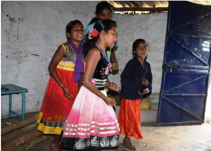
• We werden met zang en dans ontvangen

grote afwatering met hoge betonnen wanden is achter de school aangelegd. Zie de foto op het voorblad. Dit lijkt een afdoende maatregel, maar het ultieme bewijs zal in het natte seizoen moeten worden geleverd!