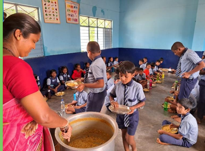
tabel 3: de scholen van het project