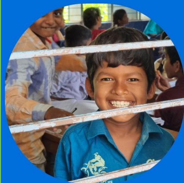
tabel 3: de scholen van het project