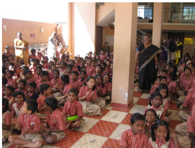
- alle kinderen zitten vroeg in de middag in de grote hal